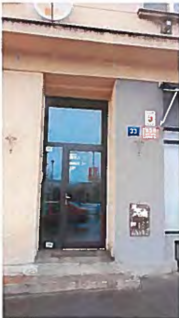
Detail vstupu do objektu